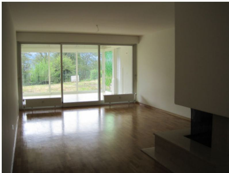
Wohnbereich mit Sicht auf den Wintergarten und Gartensitzplatz