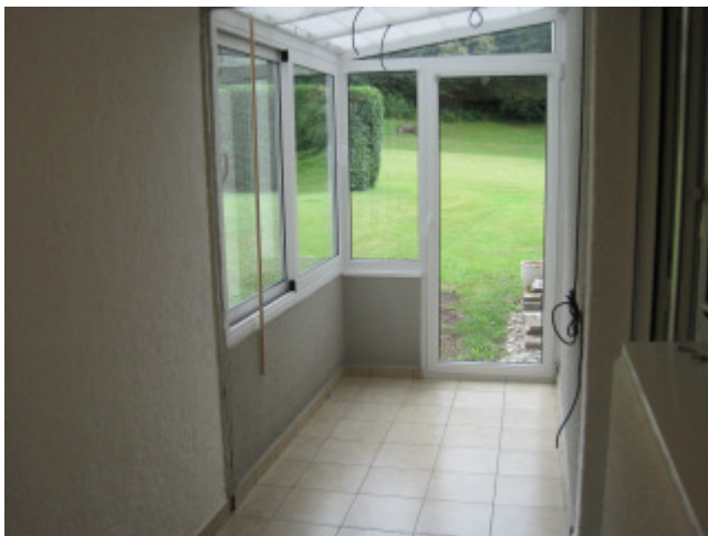
Zusätzlicher Raum zur Küche (könnte auch als Waschküche dienen)