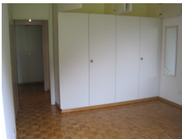
Gästezimmer mit grossen Wandschränken