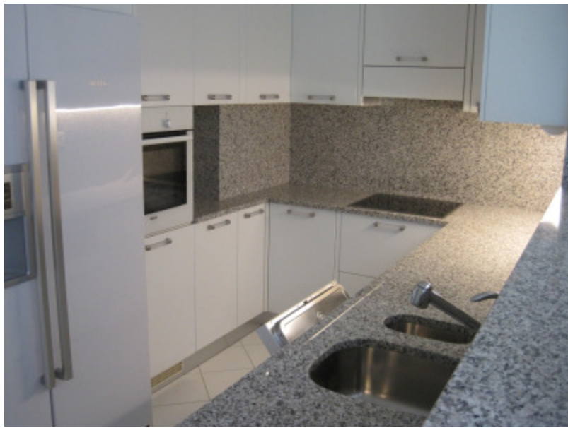
Top ausgerüstete Küche