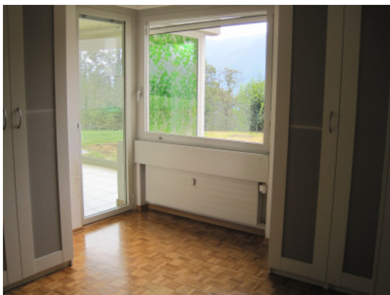
Elternschlafzimmer mit Direktzugang zum Wohnbereich und Wintergarten